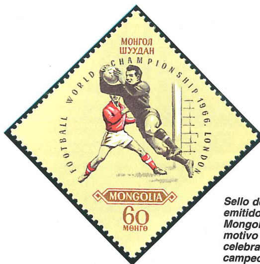
Sello de 1966 emitido por Mongolia con motivo de la celebración del campeonato mundial de fútbol.

El coleccionismo temático es uno de los más libres que existen, pero una de las costumbres más enraizadas es coleccionar según la finalidad de la emisión o sobre un tema determinado en un momento concreto. Se trata de una colección compuesta de unos sellos de una temática «ocasional», ya que los motivos de su emisión no se repetirán o lo harán muy raramente. Incluso se pueden reunir sellos de distintos países, siempre y cuando hayan