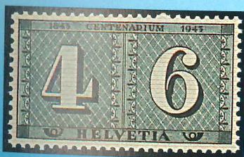
Emisión dedicada al centenario del sello de Zurich, que reproduce los tipos de la serie de 1843.