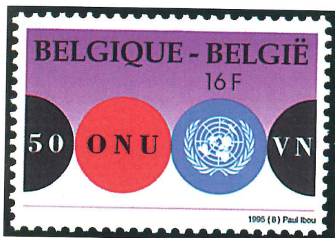
Dos de los sellos de 1995 (de Bélgica y España) dedicados a la conmemoración del cincuenta aniversario de la Organización de Naciones Unidas.