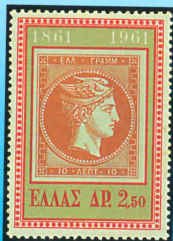
Sello sobre sello de 1961, emitido en el centenario de la filatelia griega, que reproduce la emisión de 1861.